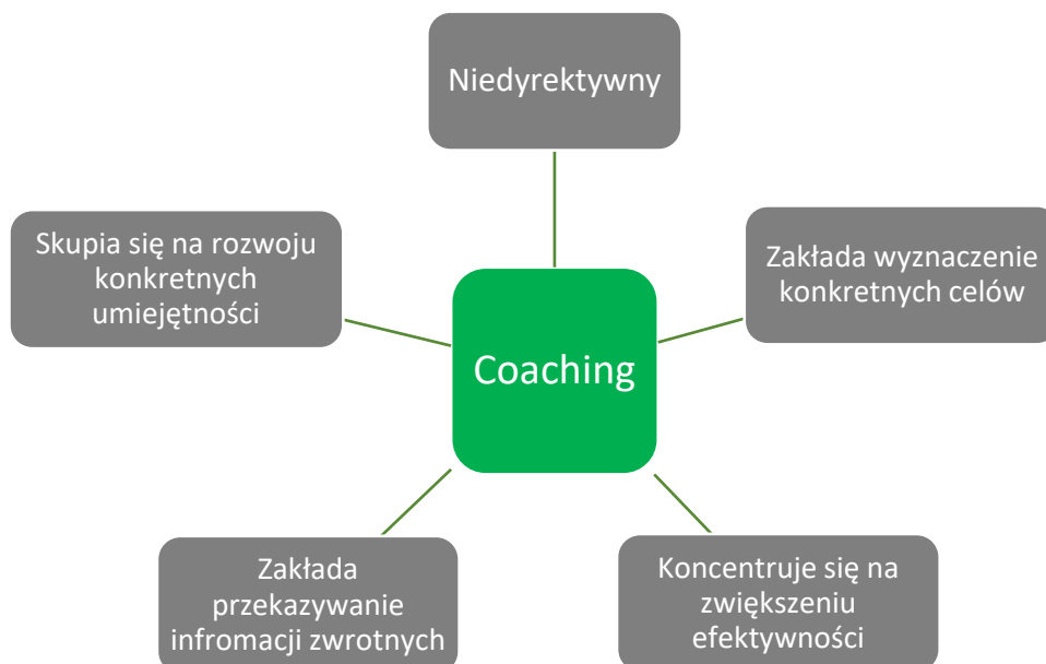
Ryc. 1. Cechy coachingu

Projekt „RESKILLING – nowe zadania dla firm z sektora MSP z branży usług opiekuńczych” jest współfinansowany przez Unię Europejską ze środków Europejskiego Funduszu Społecznego.