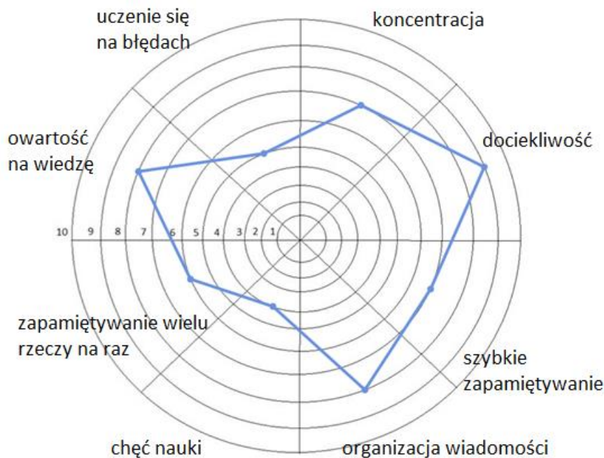
Ryc. 2 Koło priorytetów

Projekt „RESKILLING – nowe zadania dla firm z sektora MSP z branży usług opiekuńczych” jest współfinansowany przez Unię Europejską ze środków Europejskiego Funduszu Społecznego.